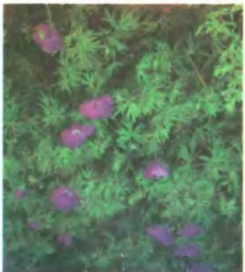
518. Герань лісова.